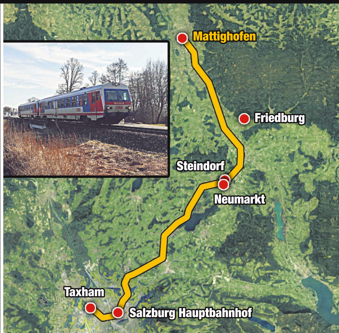
Grafik: Krone