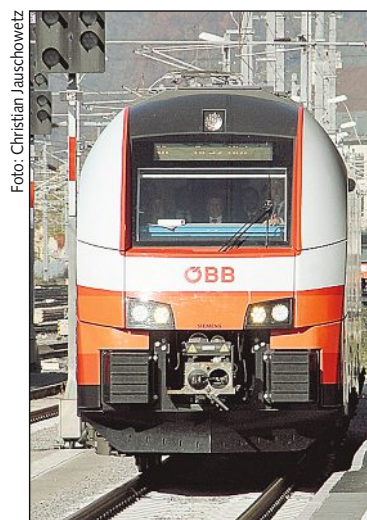
Cityjets lösen alte Schnellbahngarnituren und Nah-Züge ab.